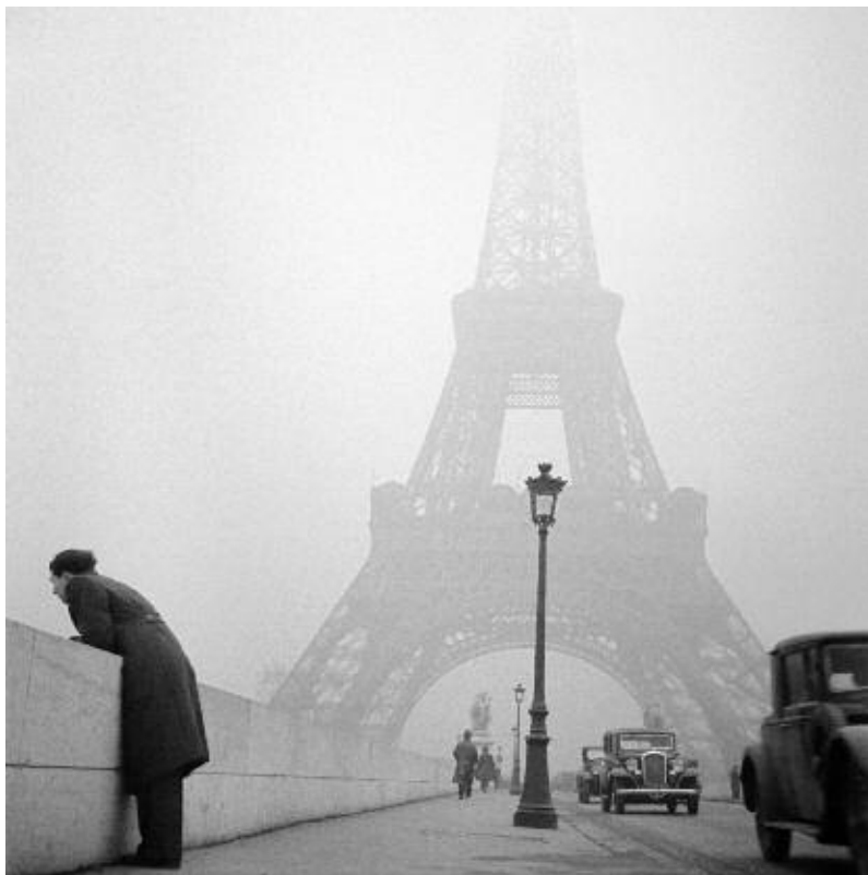
Paris 1930, Roger Schall