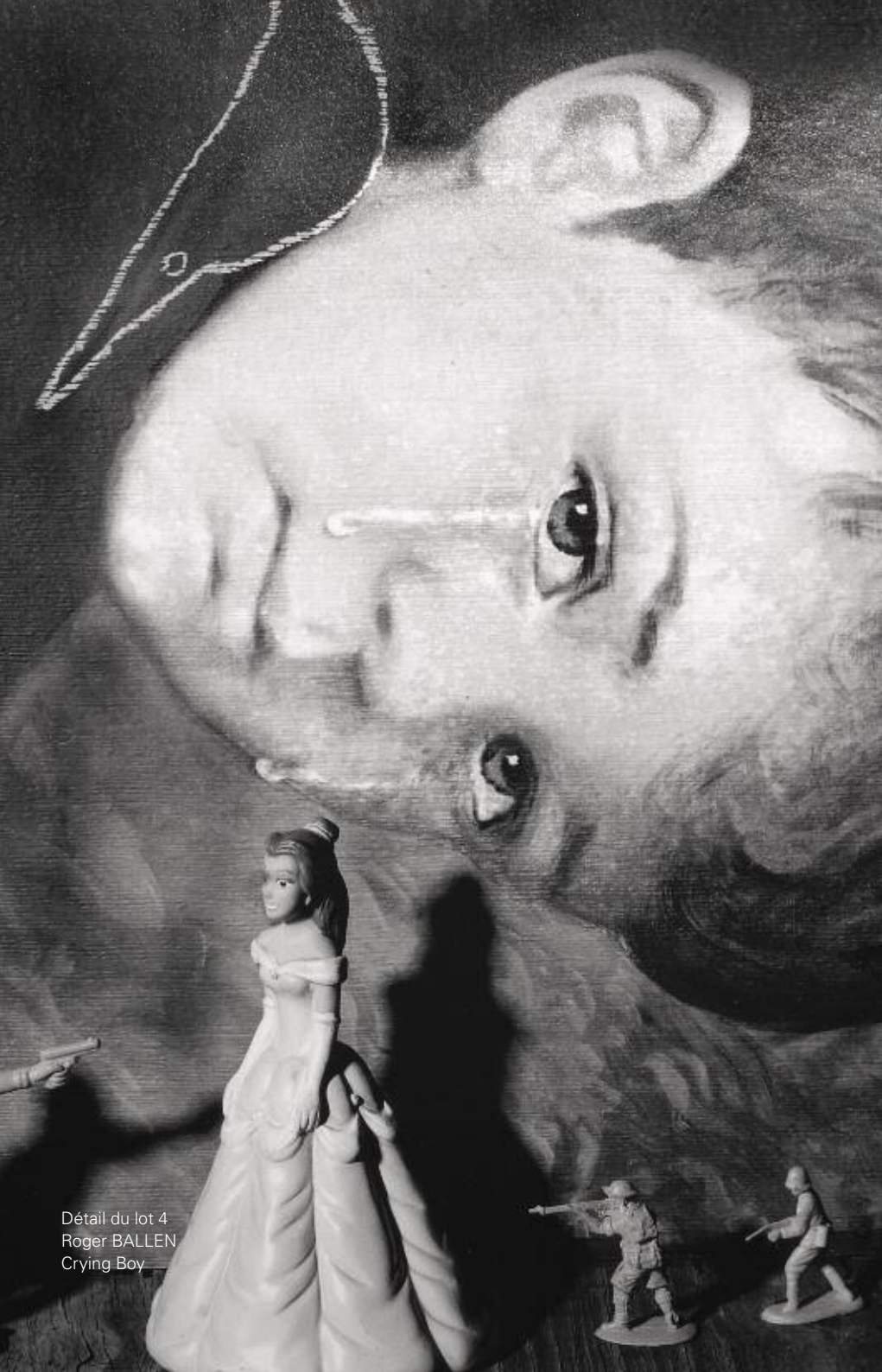
Détail du lot 4 Roger BALLEEN Crying Boy