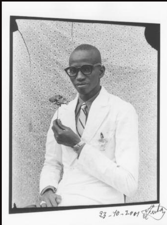
Seydou Keita, "Sans Titre (Fleur de Paris)" 1959 Tirage argentique signé, 17,8 x 23,8 cm

Lundi 19 juin - 19h00 / 6, avenue Hoche Paris