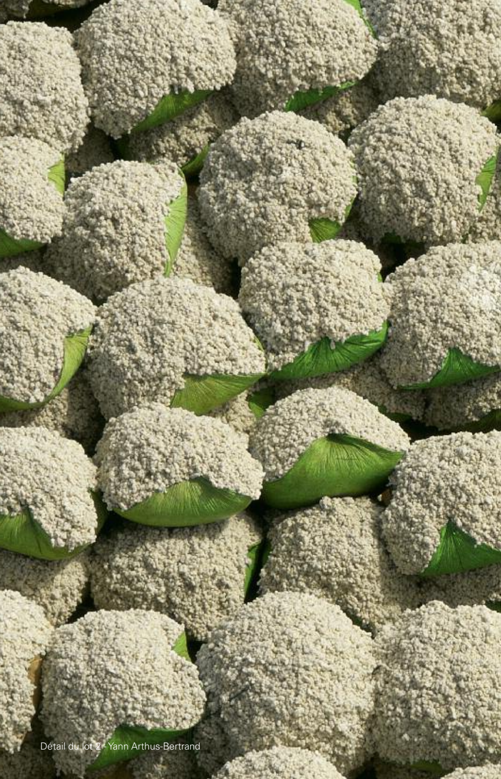
Détail du lot 2 - Yann Arthus-Bertrand